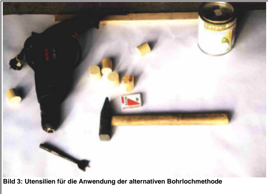
Bild 3: Utensilien für die Anwendung der alternativen Bohrlochmethode

Die so behandelten Hölzer werden bis zum Ende der sog. Durchwachsphase unter möglichst optimalen Bedingungen eingelagert.